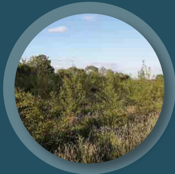
3ha de choillearnach a cuireadh faoin scéim coillearnach dúchasach

Beidh ról tábhachtach ag deontais agus fóirdheontais freisin, mar a bhíonn acu i gcónaí. Is dóigh go mbeidh baint ag suas le trian de na híocaíochtaí feirme go léir le bearta comhshaoil sa todhchaí. Ach ní féidir linn (banc a dhéanamh air seo.) glacadh go hiomlán le seo. Caithfidh daoine atá ag iarraidh difríocht a dhéanamh dul amach ag béicíl faoina dtáirge agus an tomhaltóir a spreagadh gan ceannach ón ollmhargadh.